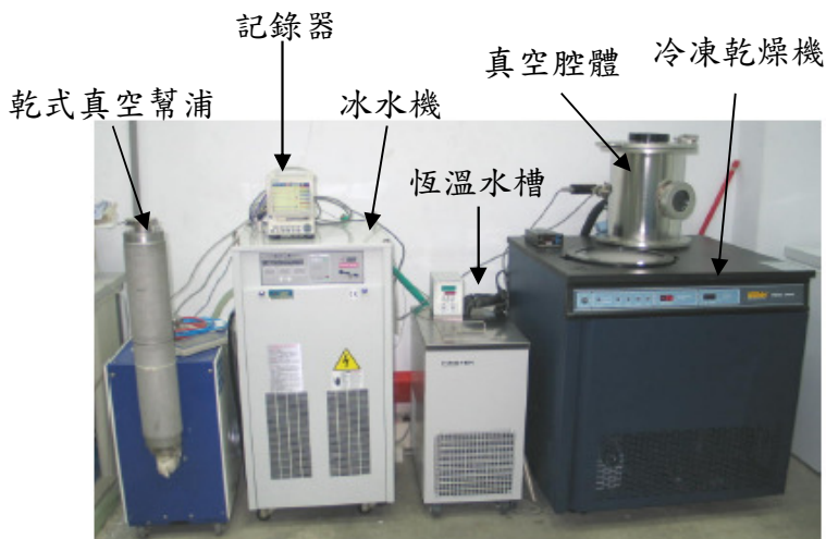
冷凍真空乾燥系統

各式真空設備及檢測儀器，油迴轉式真空幫浦、水封式幫浦、魯式幫浦、乾式真空幫浦、冷凍真空幫浦、渦輪分子幫浦、派藍尼真空計、convectron 真空計、離子真空計、氣體質量流量控制系統、氦氣測漏儀、殘留氣體分析儀、超低溫量測設備、真空冷卻設備、冷凍真空乾燥設備、微波真空系統、超低溫冷凍儲存櫃、資料蒐集擷取器、顯微觀測系統、FLOVENT 軟體、CFD-RC 軟體、各式電腦設施。